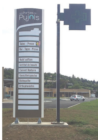
« LES PORTES DE PUJOLS »

au rond-point de LABADE, Plusieurs commerces et services y ont déjà ouvert leurs portes, on peut y trouver une pharmacie, un tabac-presse, un bar-tapas-pizzas, un coiffeur, un institut de beauté, un cabinet dentaire, un fleuriste, des kinésithérapeutes, des orthophonistes, un ostéopathe, une clinique vétérinaire, une animalerie, une boulangerie.