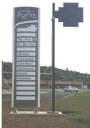
« LES PORTES DE PUJOLS »