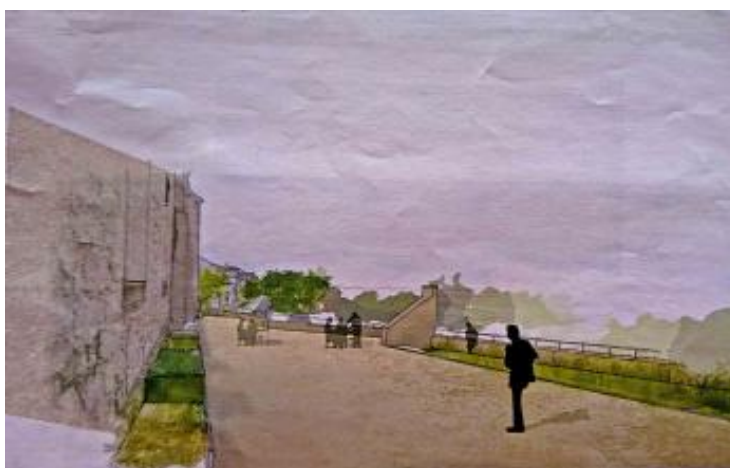
Côté table d'orientation.

Nous vous remercions pour votre compréhension quant aux éventuels désagréments qu'occasionneront les travaux en cours mais nous pensons que le résultat contribuera à une meilleure valorisation de notre patrimoine.