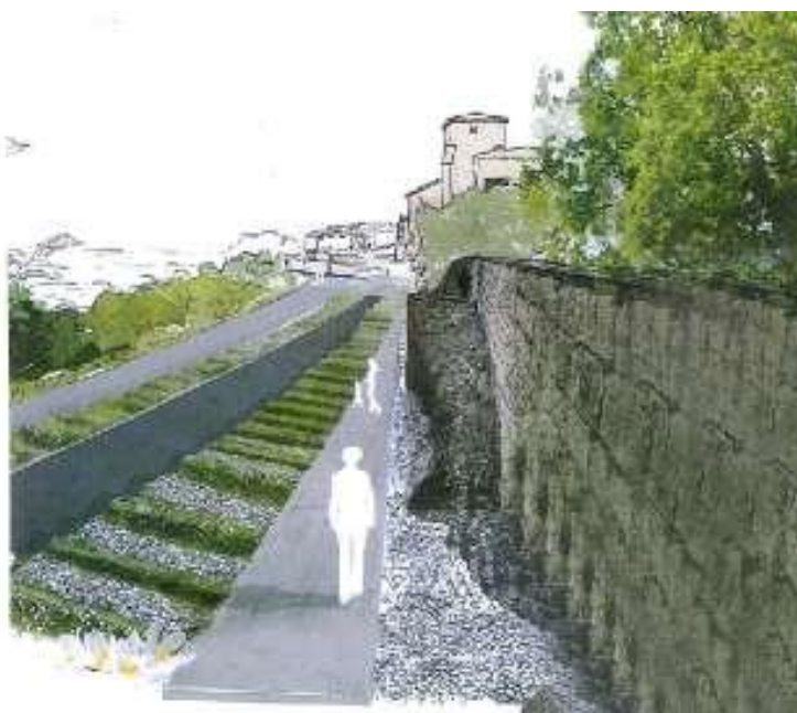
Côté côté du mont Pujols