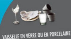
VAISSELLE EN VERRE OU EN PORCELAINÉ