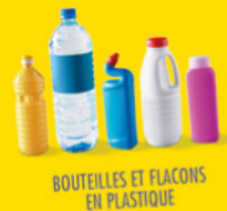
BOUTEILLES ET FLAONS EN PLASTIQUE