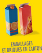
EMBALLAGES ET BRIQUES EN CARTON

EMBALLAGES EN PLASTIQUE, MÉTAL ET CARTON